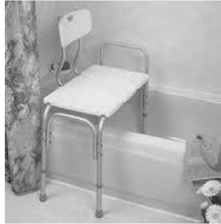
B. Banc de transfert