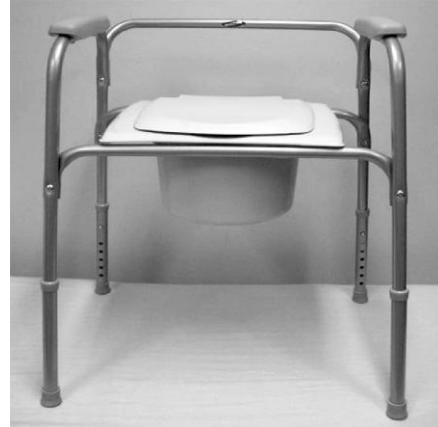
F. Siège d'aisance