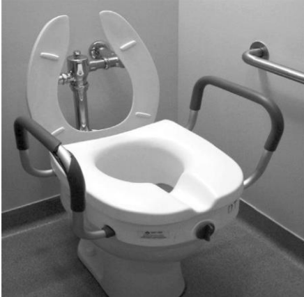
E. Siège de toilette surélevé avec appuie-bras